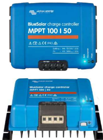
Controlador de carga solar MPPT 100/50